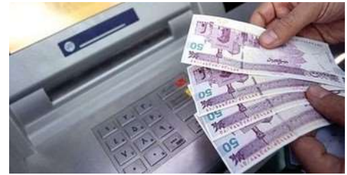
پولتو جایی سرمایه گذاری کن که بهت سالانه ۲۵.۶٪ سود موثر بده!