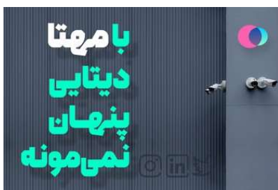
از بهر روزترین اتفاقات شبکه‌های اجتماعی مطلع شوید!