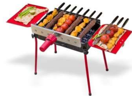
با کباب پزهای دوگانه سوز مه پویا در همه جا کباب پز همراه شماست