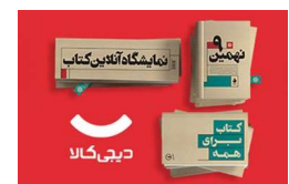
نمایشگاه آنلاین کتاب دیجی کالا