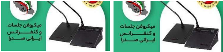
خرید میکروفون کنفرانس و جلسات ایرانی صدرا | میکروفون کنفرانس و جلسات ایرانی برند صدرا