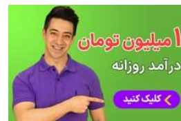
ماهانه ۳۰ میلیون درآمد داشته باش