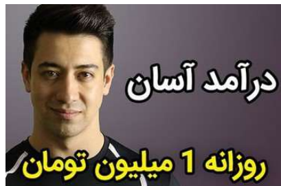
بدون سرمایه ساعتی ۴۲ هزار تومان درآمد داشته باش!