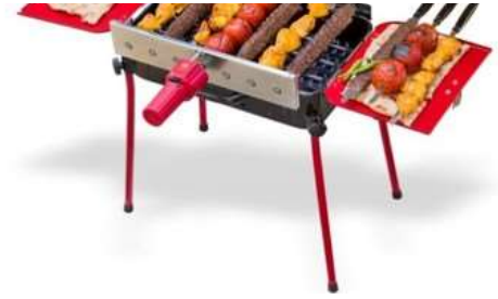
با کباب پزهای دوگانه سوز مه پویا در همه جا کباب پز همراه شماست