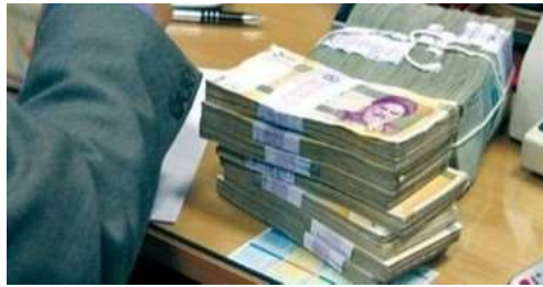
سرمایه گذاری امن با کمترین ریسک | ۲۵.۶٪ سود موثر سالانه روز شمار