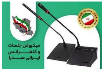
خرید میکروفون کنفرانس و جلسات ایرانی صدرا