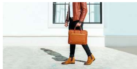
یک خرید لذت بخش همراه با ارسال رایگان در چرم رجحان