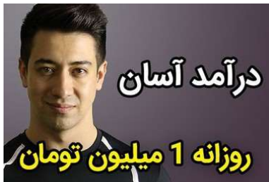
بدون سرمایه ساعتی ۴۲ هزار تومان درآمد داشته باش!