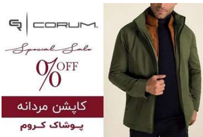
از کروم با ۵۰% تخفیف کاپشن بخر! (به مدت محدود)