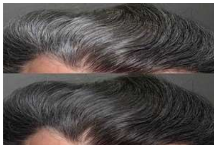
رفع سفیدی + رشد مجدد و احیا دوباره مو (۱۰۰% گیاهی)

● میزیتو نرم افزار مدیریت پروژه و گانت چارت فارسی ●