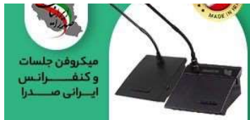
خرید میکروفون کنفرانس و جلسات ایرانی صدرا