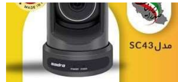
دوربین کنفرانس و ویدئو کنفرانس ایرانی صدرا

● میزیتو نرم افزار مدیریت پروژه و گانت چارت فارسی ●